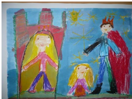
Lódi Kitti Rozina: Mátyás és a bíró lánya