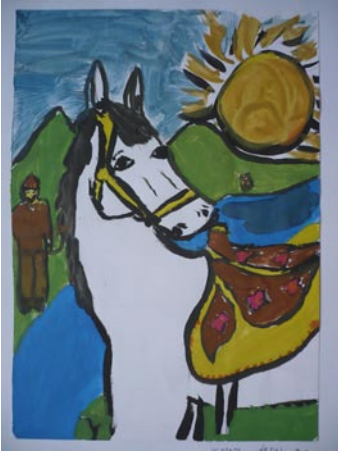
Schandl Áron: A fehér ló mondája