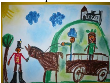
Vass Nátán: Mátyás király és a török szultán