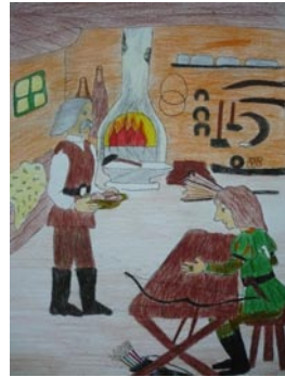
Tóth Máté: Az Öreg-kovács hegy