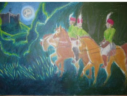
Kohl Enikő: Az érckakas