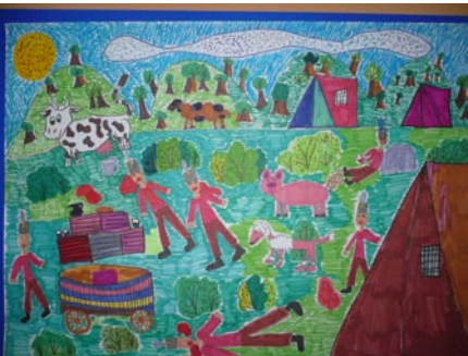
Pintér Kira: Vértes