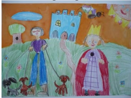
Székely Zsófia: Egyszer volt Budán kutyavásár