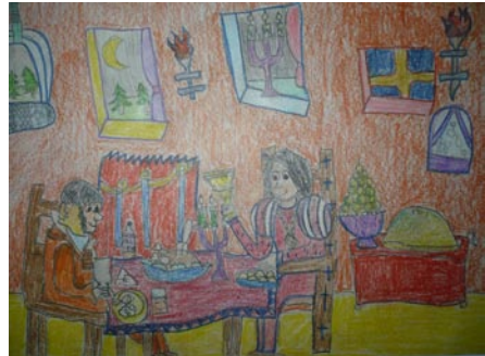
Farkas Kira: Az öreg kovács és Mátyás király