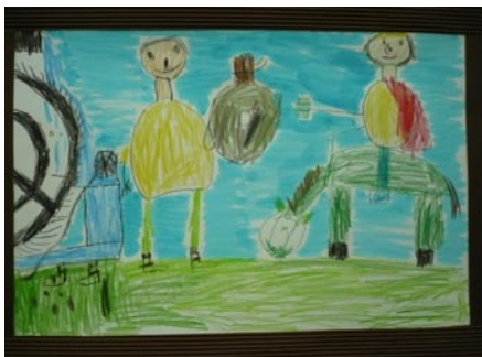
Ragály-Németh Albert: Mátyás király és Kinizsi Miklós