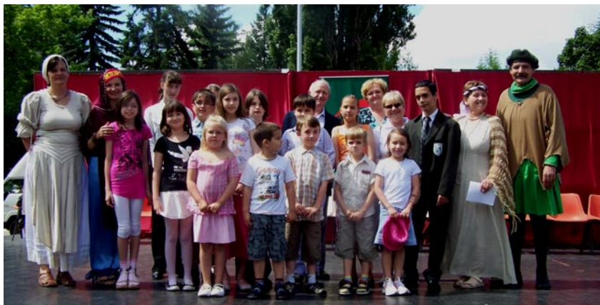
A SZELIM-NAPI REGÉLŐ PÁLYÁZATÁNAK DÍJAZOTTJAI, A ZSÚRI ÉS A DÍJAK ÁTADÓI A VÁROSI GYERMEKNAPON 2010 MÁJUS 28-ÁN.

A tatabányai Tájak, Emberek Környezet Egyesület (TEKE) Regélők csoportja rajz- és mondaíró pályázatot írt ki a Gerecse- és Vértes hegység legendáiról. A gyerekek rajzolni lehetett, vagy kitalálni egy történetet egy földrajzi helyről, történelmi személyről, vagy – eseményről.