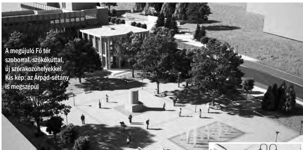
A megújuló Fő tér szoborral, szökőkúttal, új szórakozóhelyekkel. Kis kép: az Árpád-sétány is megszépül