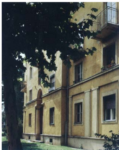
Győri úti munkáslakóház