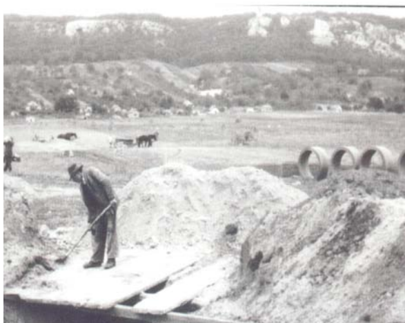
Az első kapavágások Újváros építésénél (1951)