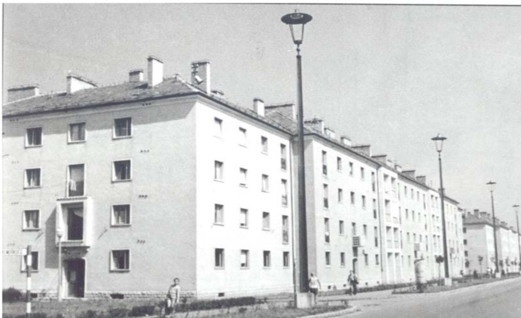
Az első újbárosi házak a mai Győri úton ( Tatabánya Anno c. könyvből)