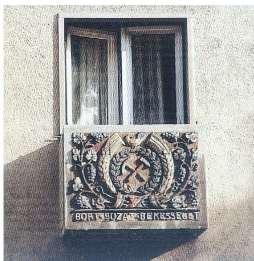
Típuslakóház, terrakotta erkélydíszt

/Forrás: Tatabánya 2000-ben fotóalbum/ (Tervező: Károlyi Antal)